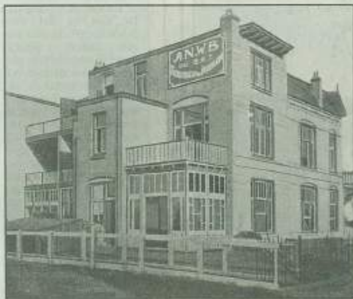
† Het vroegere consulaat van de ANWB op de hoek van de Van Pallandtstraat en de Amsterdamseweg.