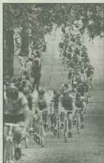
♦ Een beeld dat tot het verleden behoort. Een langgerekt peloton in de Ronde van De Paasberg.

Hij is niet meer bij de wielersport betrokken, maar zijn ringbanden met statistieken en informatie worden nog wekelijks aangevuld. De winnaars van de Ronde van De Paasberg kan hij direct opsommen. Die galerij is illustratief voor de rijke historie van De Paasberg. In 1955 mocht Ab Geldermans, zes jaar later vijfde in de Tour de France en ook winnaar van Luik-Bastenaken-Luik, zich laten bejubelen. „Vijftien jaar na